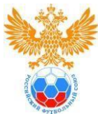
Эмблема ДЮСШ (клуба)