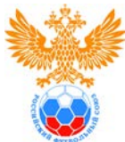
Эмблема ДЮСШ (клуба)