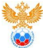
Эмблема ДЮСШ (клуба)